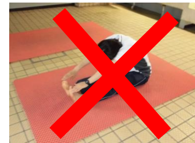
プール内ストレッチマット